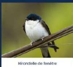
Hirondelle de fenêtre

Participez au recensement national des colonies d'hirondelles. Si une colonie d'hirondelles s'est installée chez vous ou sur votre commune, il suffit de la signaler !