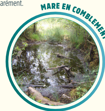
MARE EN COMPLEMENT

Comment ? Curer le fond tous les 5 à 10 ans (voire plus), de façon manuelle ou mécanique sans dépasser les 2/3 de la surface de la mare. Attention à ne pas percer la couche imperméable d'argile ! Prenez conseil !