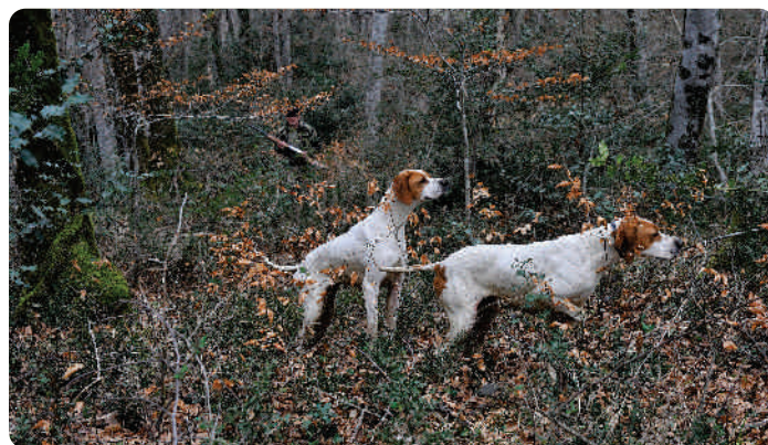
Le pointer est réputé pour ses arrêts spectaculaires

Le plaisir de la chasse au chien d'arrêt réside principalement dans la qualité du travail du chien : lorsque celui-ci perçoit la présence de gibier, il se fige, parfois de manière spectaculaire, laissant le soin au chasseur de se positionner. Quand le gibier est éloigné, ou tente de fuir au sol, le chien remonte alors lentement et prudemment la piste de ce dernier pour se figer à nouveau, dans l'attente du brusque départ du gibier. A l'envol, le chien reste sage.