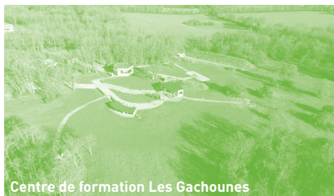
Centre de formation Les Gachouines