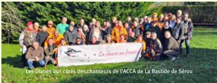
Les Dianes aux côtés des chasseurs de l'ACCA de La Bastide de Sérou

En janvier l'ACCA de La Bastide de Sérou a reçu les Dianes d'Ariège et des Landes. Après lecture des consignes de sécurité, une vingtaine de chasseresses ont participé avec les chasseurs locaux à une battue aux cervidés. Malgré des conditions particulièrement boueuses, la battue s'est très bien déroulée. Les animaux étaient au rendez-vous, plusieurs d'entre eux ont été prélevés et les Dianes ont largement contribué à la réussite de cette matinée. Bien sûr quelques chants sont venus ponctuer le repas. Là encore les Dianes se sont illustrées avec la chanson qui met en valeur la chasse ariégeoise qu'elles ont composée. Les Dianes ont fait preuve de dynamisme, de sérieux et de motivation. Il ne fait donc aucun doute que la chasse au féminin a de beaux jours devant elle.