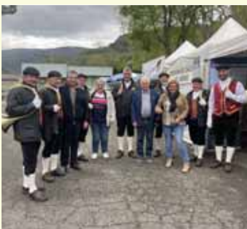
Mr Fernandez aux côtés de Mme la Députée, Mr le Maire de Tarascon, son adjointe et des sonneurs, les échos de Combelongue.

Le chien était à l'honneur de la deuxième édition de cette belle manifestation parfaitement orchestrée par les ACCA locales. Le samedi 19 avril sur le foirail de Tarascon de nombreux visiteurs étaient au rendez-vous pour profiter des expositions canines, démonstrations et animations. La Fédération était présente avec un stand et le simulateur de tir très apprécié de tous. Un marché de producteurs et des stands de restauration ont régalié les gourmands de spécialités locales.