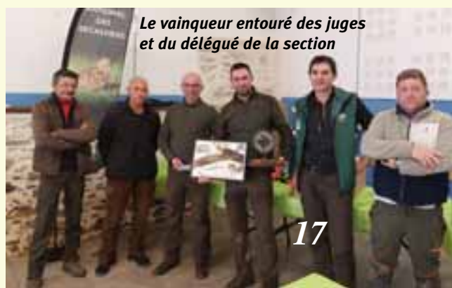
Le vainqueur entouré des juges et du délégué de la section