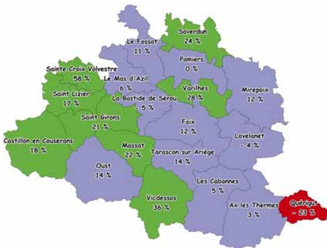
Variations annuelles du tableau de chasse sanglier par canton entre 2023/2024 à 2024/2025

■ Augmentation : >15 % ■ Baisse : <15 % ■ Stable : Entre -15 % et +15 %