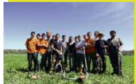
L'équipe de lycéens qui a œuvré au chantier

Les chantiers école du lycée agricole de Pamiers sont animés par le service technique de la Fédération. Ils sont en particulier orientés sur la réhabilitation des zones humides. Nous intervenons ainsi sur le domaine des oiseaux à Mazères, le marais de Rolle à La Bastide de Bousignac ou les mares de Trémoulet. Le chantier s'est déroulé du 7 au 11 avril derniers à La Bastide de Bousignac. Il a été consacré au débroussaillage de la future clôture destinée à accueillir un troupeau de bovins. Le pâturage est en effet la gestion la plus adaptée au marais de Rolle. Il permet de conserver les prairies humides et de lutter contre la déprise agricole qui se traduit ici par une colonisation rapide des végétaux ligneux (prunellier et aubépine). D'autres travaux sont prévus sur le site. Ils viseront à réhabiliter des mares anciennes afin de maintenir l'eau de pluie sur le site.