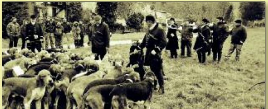
Ste-Croix Volvestre : la curée