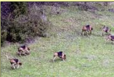
Lérans : Les chiens sur la quête du lièvre

UNE CHASSE À COURRE SUR SANGLIER s'est déroulée le 22 mars à Sainte Croix Volvestre. Après avoir fait le pied, un sanglier a été repéré. L'équipage Comminges Barousse a lâché une quinzaine de rapprocheurs. Une fois le sanglier lancé, le reste de la meute a été découplée. Au bout de 3 heures, le sanglier a été pris. Après la curée, un moment de convivialité et d'échanges est venu clôturer cette journée.