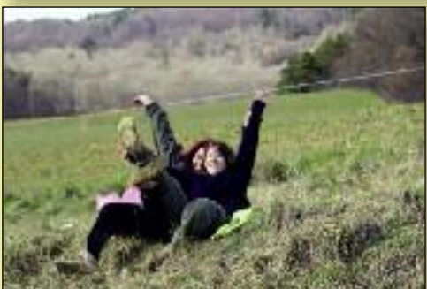
Lérans : Des spectatrices enthousiastes