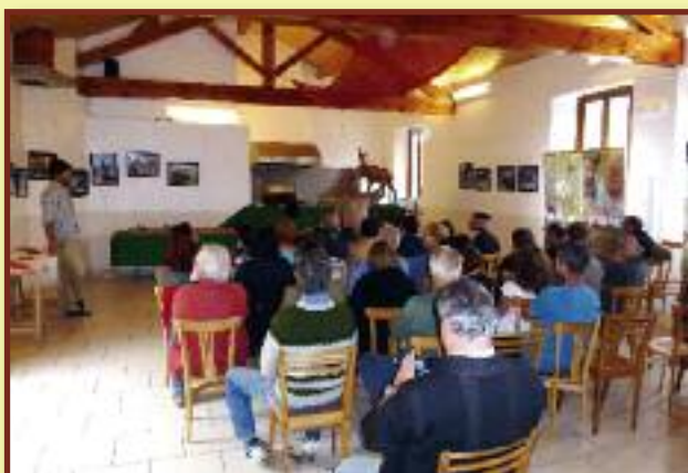
Fête de la Chasse, Lercoul