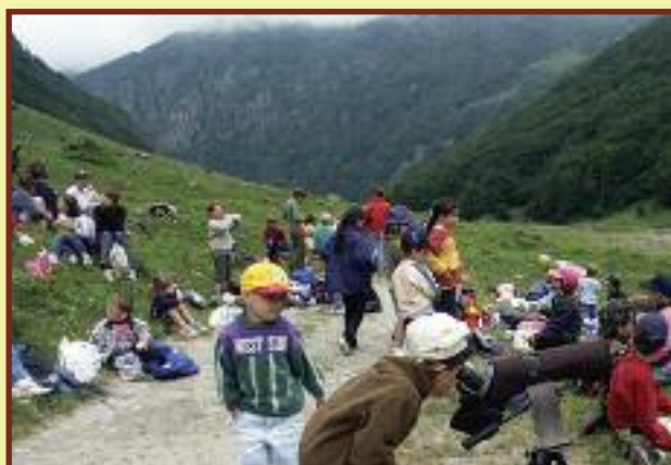
Journée portes ouvertes dans la réserve nationale d'Orlu