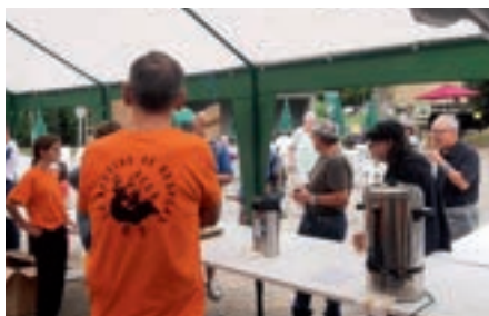
FORÊT EN DONEZAN

Dimanche 27 juillet 2025, l'ACCA de La Bastide de Besplas a organisé son traditionnel vide-greniers annuel. Un moment de pure convivialité à ne pas manquer.