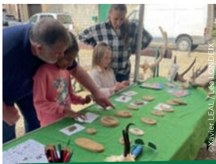
FOIRE DU 1 ER MAI AU MAS D'AZIL

A u cours des dernières semaines, la Fédération Départementale des Chasseurs de l'Ariège, accompagnée de plusieurs ACCA, a eu le plaisir de participer à de nombreux événements estivaux en proposant des stands valorisant notre passion.